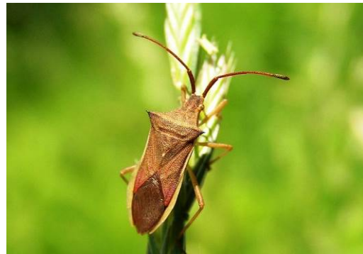
写真2 ホソハリカメムシ