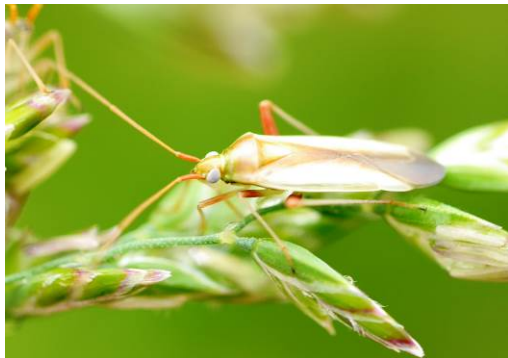
写真1 アカスジカスミカメ