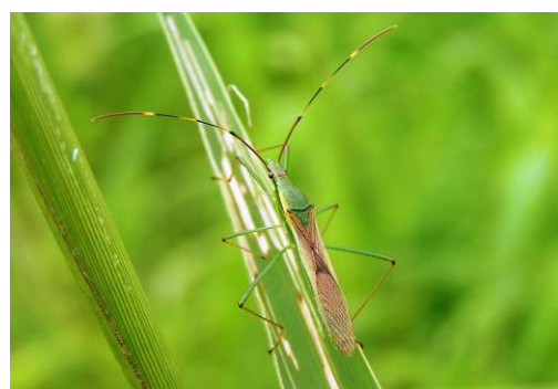
写真4 クモヘリカメムシ