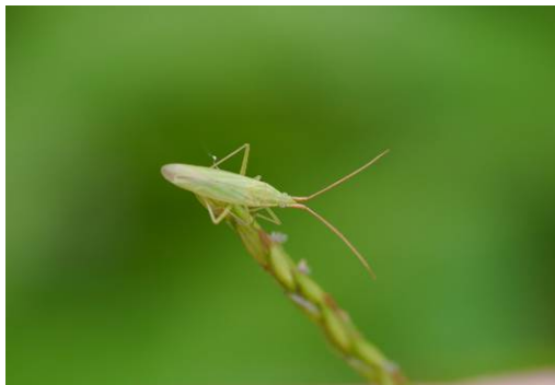
写真3 アカヒゲホソミドリカスミカメ