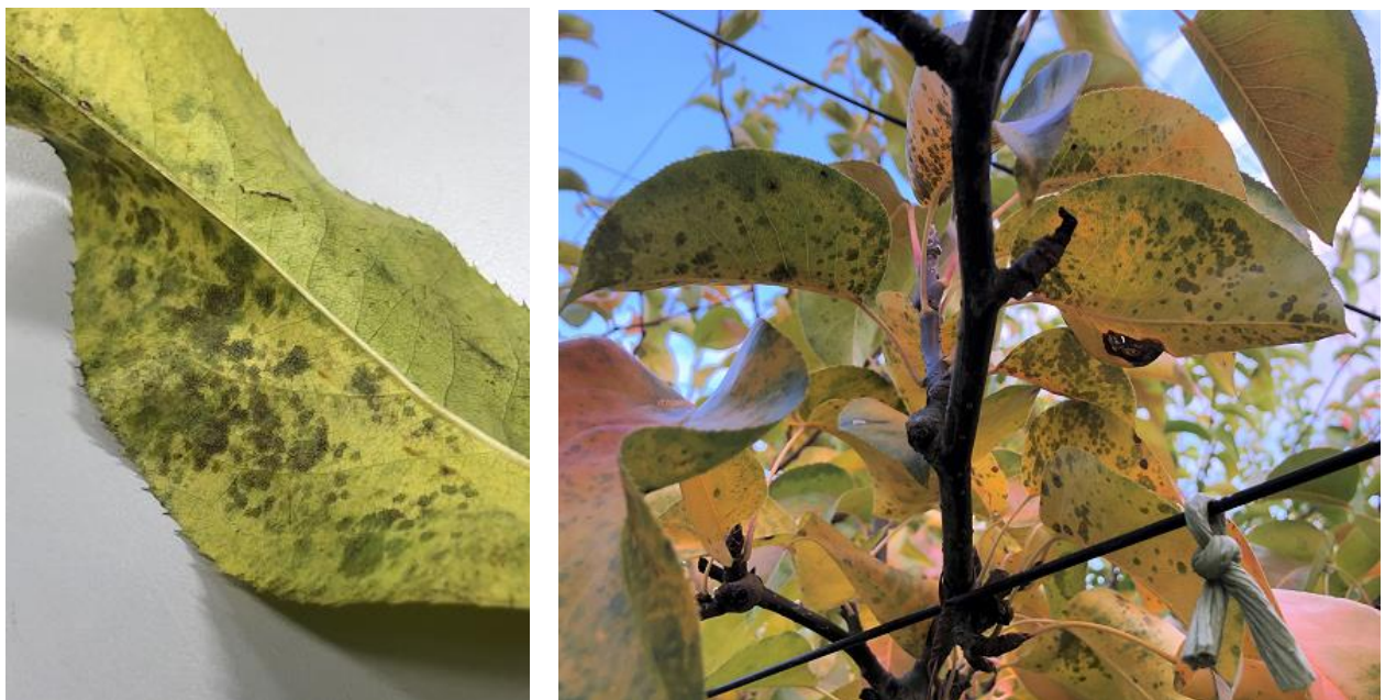
図4 罹病葉 (秋型病斑) (撮影：令和2年11月4日)

●情報内容への質問は福島県農業総合センター安全農業推進部発生予察課 (病害虫防除所) までご連絡ください。本情報は、福島県病害虫防除所ホームページ ( https://www.pref.fukushima.lg.jp/sec/37200b/ ) でもご覧になれます。 TEL：024-958-1709 FAX：024-958-1727