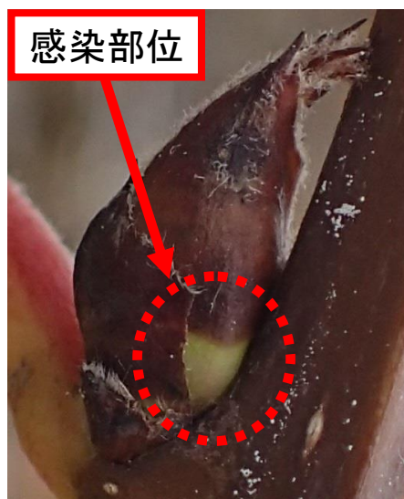
図2 露出したりん片生組織