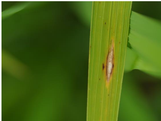
写真1 葉いもちの病斑