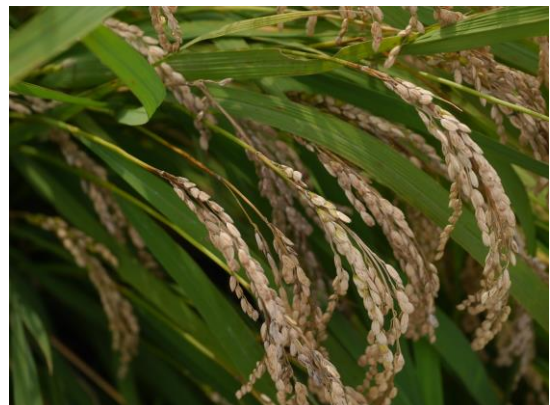
写真2 穂いもち（穂首いもち）の発生の様子