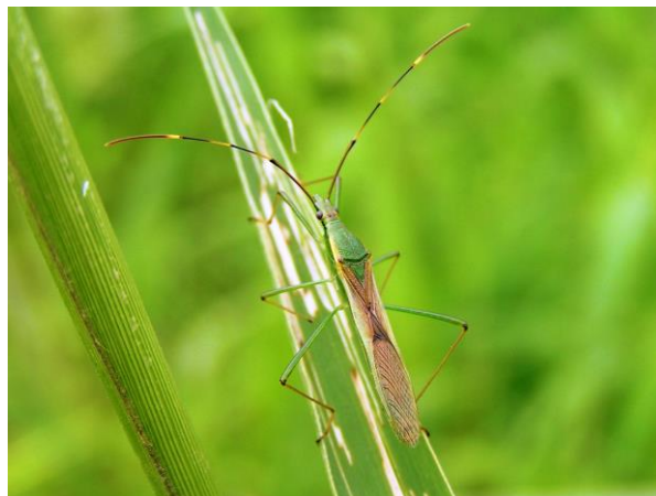
写真4 クモヘリカメムシ