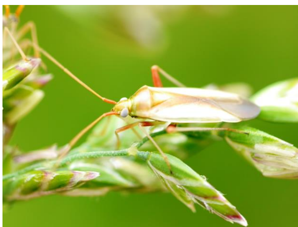
写真1 アカスジカスミカメ