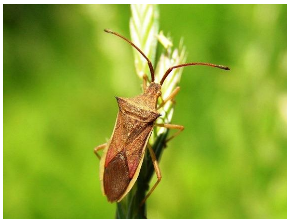
写真2 ホソハリカメムシ