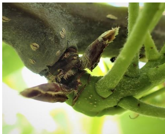
図1 ナシ黒星病果そう基部の発生状況（5月上旬、下旬） 調査地点：中通り19園地、浜通り10園地