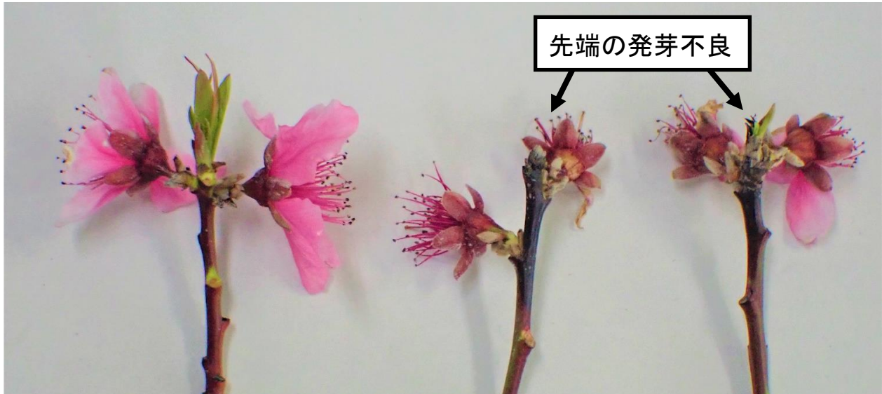
図1 枝先に発生した春型枝病斑（左：健全な枝 中央、右：発病枝）